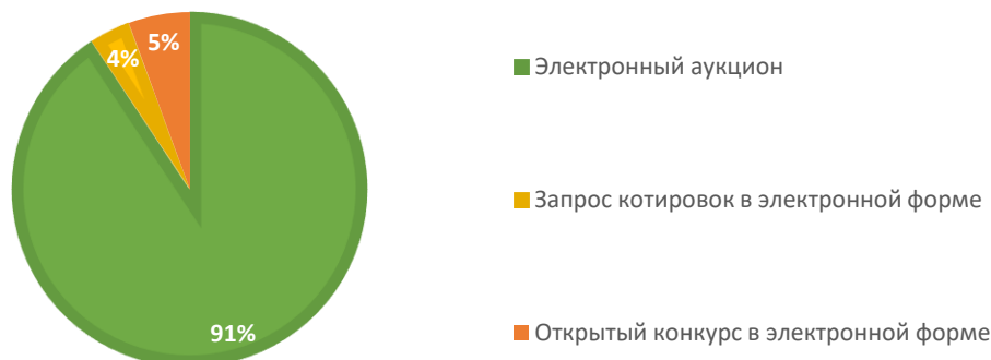
Диаграмма №1 Количество проведенных закупок товаров, работ, услуг для обеспечения муниципальных нужд Южского городского поселения Южского муниципального района конкурентными способами в 2022 году, (%)

Как видно из диаграммы, среди конкурентных способов определения поставщиков (подрядчиков, исполнителей) в 2022 году аукцион в электронной форме является самым востребованным способом.